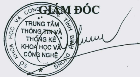
Trần Trọng Tuyên